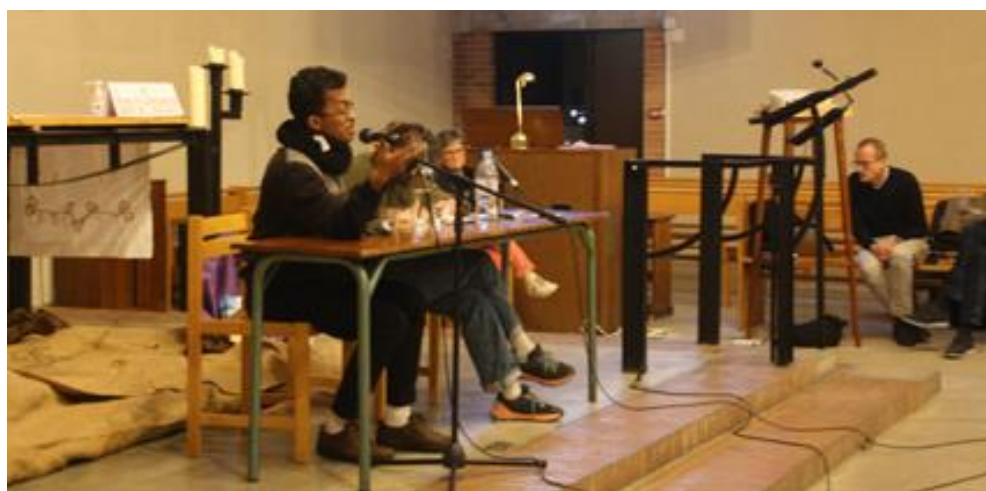
Soirée à l'église St Médard de Doulon

Venez partager votre vécu de la campagne de Carême et autres animations pour nous enrichir les uns les autres et mutualiser nos expériences. Le samedi 18 juin de 9h à 12h à la Maison Diocésaine St Clair , incluant un temps de partage sur l'accueil et le recrutement des bénévoles.