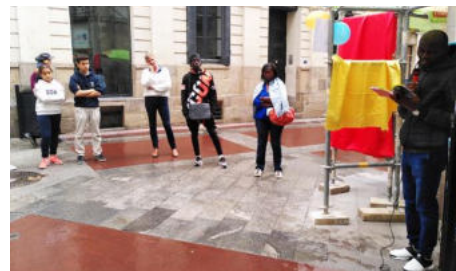
Migrants en marche