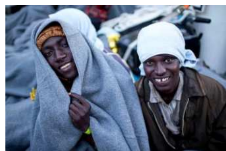
reportage sur l'Aquarius